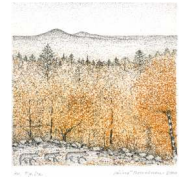
“Ruskaretki” Vainö Rouvinen