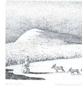
“Hankikanto” Vainö Rouvinen