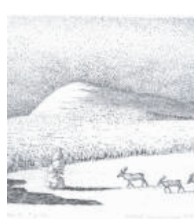
Kuva-aihe 4: Väinö Rouvinen Hankikanto

Väinö Rouvisen viivasyövytystyö, josta hänelle ominaisella tavalla välittyvät katsojalle niin luonnon kauneus kuin Lapin kaamoksen salaperäisyyksin. Kuvassa talven keskelle unestaän herännyt Lampivaaran karhu katselee kummastellen lumilakeudella revontulien alla vaeltavia ihmishahmoja.