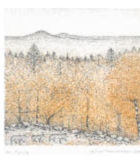
Kuva-aihe 5: Väinö Rouvinen Ruskaretki

Kaamoksen Satu on viivasyövytystyö, joka korostetun yksinkertaisella tavalla henkii Lapin ikiaikaista mystiikkaa. Kuvassa toisiinsa kietoutuneet säänvalkaisemat kelopuut keinuvat ajan virrassa Lampivaaran jylhää tunturiprofiilia vasten.